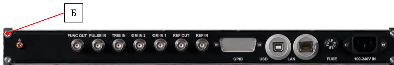
Рисунок 6 – Вид сзади модификаций RFS40-2, RFS40-3, RFS40-4 и схема пломбировки от несанкционированного доступа (Б)