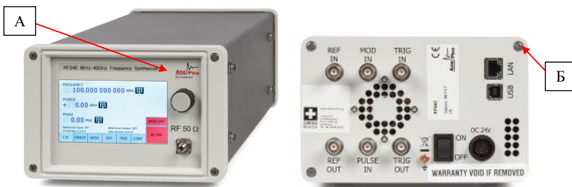
а) вид спереди